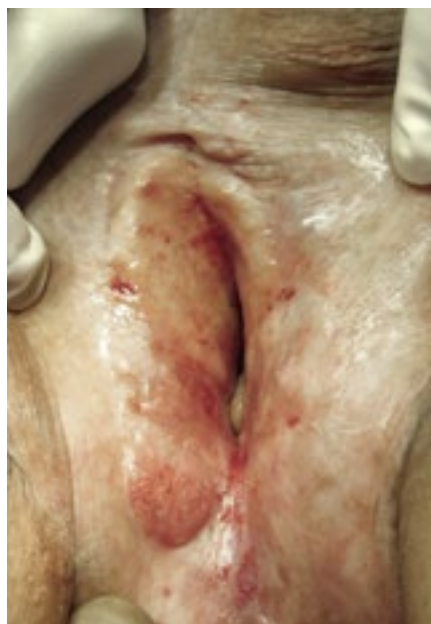
Über Jahre unbehandelter LS mit Krebsvorstufe an der rechten Labie.

sachen sind unbekannt, Schübe können aber v. a. durch Traumata im Genitalbereich ausgelöst werden. Auch Ernährung kann einen negativen Einfluss nehmen; berichtet wird von scharfem Essen oder auch säurehaltigen Getränken oder Zitrusfrüchten, die Unterschiede sind hierbei jedoch individuell erheblich. LS kann erblich sein, in etwa 50% der Fälle findet man weitere Familienangehörige, die betroffen sind (eigene, nicht publizierte Daten).